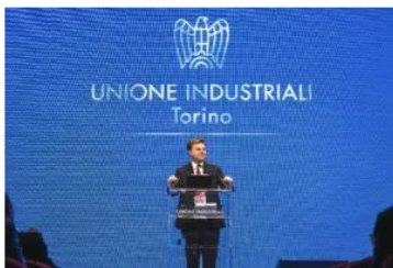
Marco Gay, il presidente di Unione Industriali di Torino, ha ribadito l'importanza del digital manufacturing in occasione dell'assemblea generale di fine ottobre dell'associazione.

In questo contesto si inserisce dunque la scommessa di Lutech sulla città. Il system integrator lavora già con Rai, Alpitour, Iveco, Lavazza . La specializzazione nel digital manufacturing va nella direzione tracciata da Marco Gay in occasione dell'assemblea generale di fine ottobre: mettere insieme le competenze della città nel settore automotive con l'innovazione digitale.