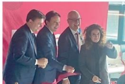
L'inaugurazione La sede in lungo Dora Colletta