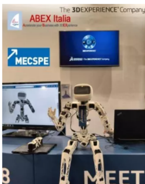
Abex, oltre a essere platinum partner di Dassault Systèmes, è specializzata digital manufacturing.

Anche l'economia dell'intero Piemonte, pur in crescita, in base al consueto report della Banca d'Italia sulle economie regionali, segnala per il 2023 incrementi decisamente contenuti rispetto a quello dell'anno prima (pil +0,9 per cento, dal 2,7 del 2022). Il rallentamento dell'economia si è in realtà verificato su scala nazionale, investendo in particolare l'industria, ma Torino aggiunge al contesto le preoccupazioni sul futuro dell'industria dell'auto.